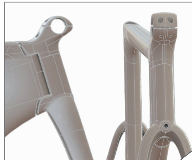
Aerodynamický systém uchytenia prednej vidlice Bayonet 3

Pevnosť. Rýchlosť. Výkon. Spoločne sú tieto tri požadované vlastnosti základom pri stavbe bicykla. Každá z nich je mimoriadne dôležitá i sama o sebe, ale len reálny test potvrdí synergickú kombináciu týchto atribútov. Ich súhra je oveľa lepšia, ako keď pôsobia samostatne.